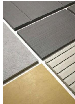
StoVentec FibreCement Finition teintée dans la masse

Agence FP&A - Céline GAY 01 30 09 67 04 - 07 61 46 57 31 celine@fpa.fr