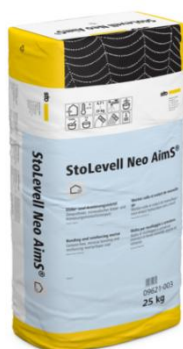
Nouveau sous-enduit d'ITE StoLevell Neo AimS® © Sto